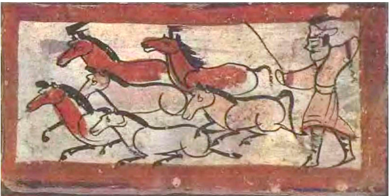
Рис. 2. Табунщик-ху. Погр. 5, могильник Синьчэн, Цзяюйгуань По: [Цзяюйгуань хуасянчжуань, 1976].

Гао Жун, Цзя Сяоцзюнь, Пу Чжунъюань. Ханьхуа юй хухуа: хань тан шици Хэсидэ миньцзу жунхэ [Китаизация и варваризация: национальная интеграция в регионе Хэси в период Хань–Тан]. Пекин, 2018.