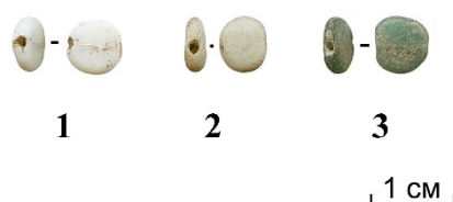
Рис 1. Стекланные бусы из погребения одиночного кургана у дер. Холмы

Sleen W.G.N. van der. A Handbook on Beads. Liege, 1973.