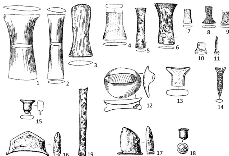
Рис. 1. Лабретки из камня (1–18) и кости (19)

Лабретки изготавливали чаще из мягкого светлого камня, кости, рога, иногда из древесины; они крепились обычно парно через проделанные отверстия в углах рта и на губах, особые разновидности изделий – в носовой перегородке. Нижнеамурские лабретки в основном из трепела эпохи неолита (найлены в шести пунктах) линзовидные в сечении подпрямоугольные предметы длиной от 4–5 до 9,7 см с расширяющимся одним или двумя концами (рис. 1/ 1–9). Основные районы современного распространения лабреток – Меланезия и Полинезия, зона расселения индейцев Северной и Южной Америки, западных эскимосов и алеутов были названы в работе XIX в. [Dall, 1884]. Есть сведения о лабретках коренных обитателей Австралии [Народы..., 1956]. Археологические лабретки найдены гораздо севернее экватора. Их локализация связана преимущественно с побережьями и островами Охотского и Берингова морей, в т.ч. части западного побережья Северной Америки.