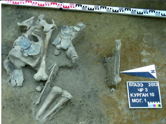
Рисунок 3. Курган 10, могила 1.