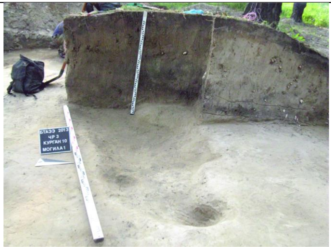
Рисунок 2. Стратиграфический разрез насыпи и могильной ямы кургана № 10.