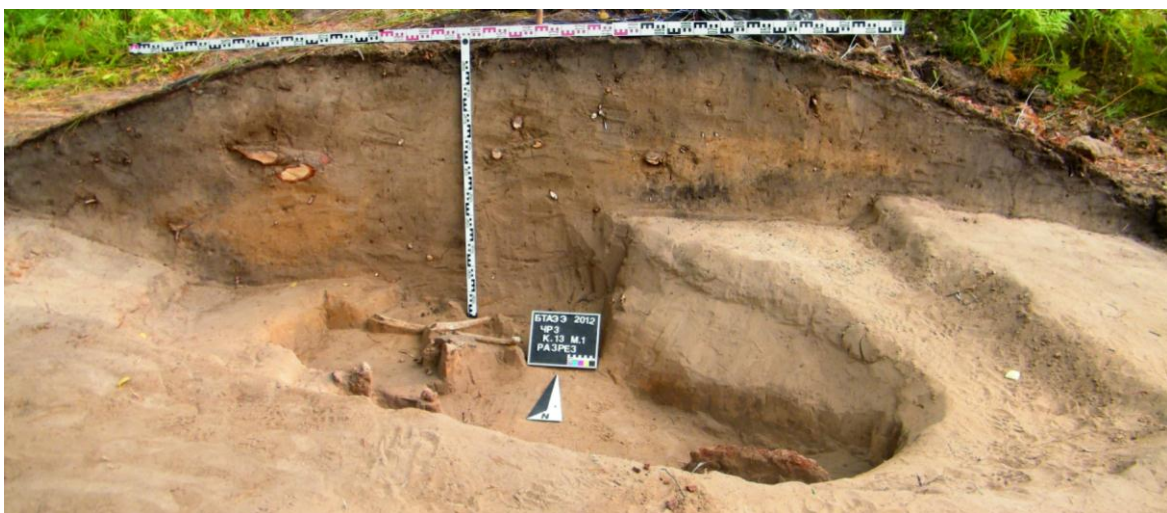
Рисунок 5. Разрез насыпи и могилы кургана № 13.