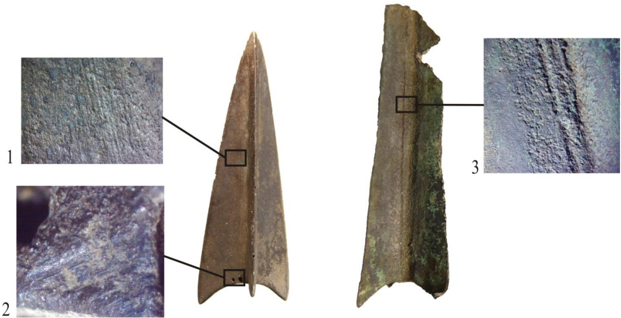
Рис. 2. Наконечники стрел со следами моделирования и обработки 1 – следы обработки абразивом; 2 – режущий след по пластичной модели; 3 – следы спаивания лопастей