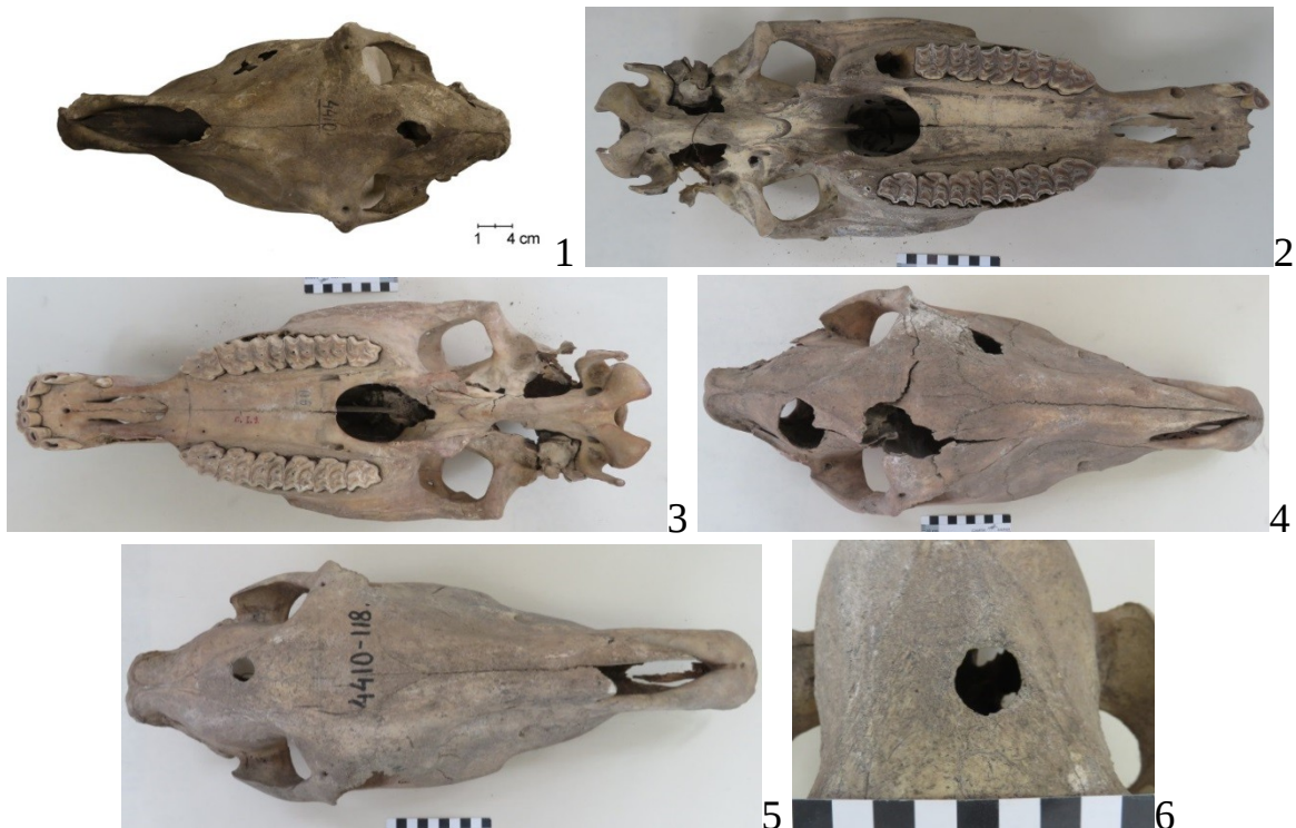
Рис. 2. Черепа из курганов памятника Бийск-I